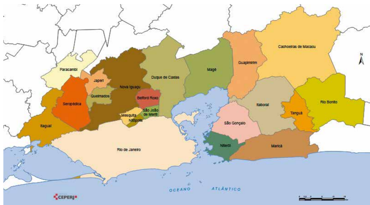
MAPA 1 - Região Metropolitana do Rio de Janeiro